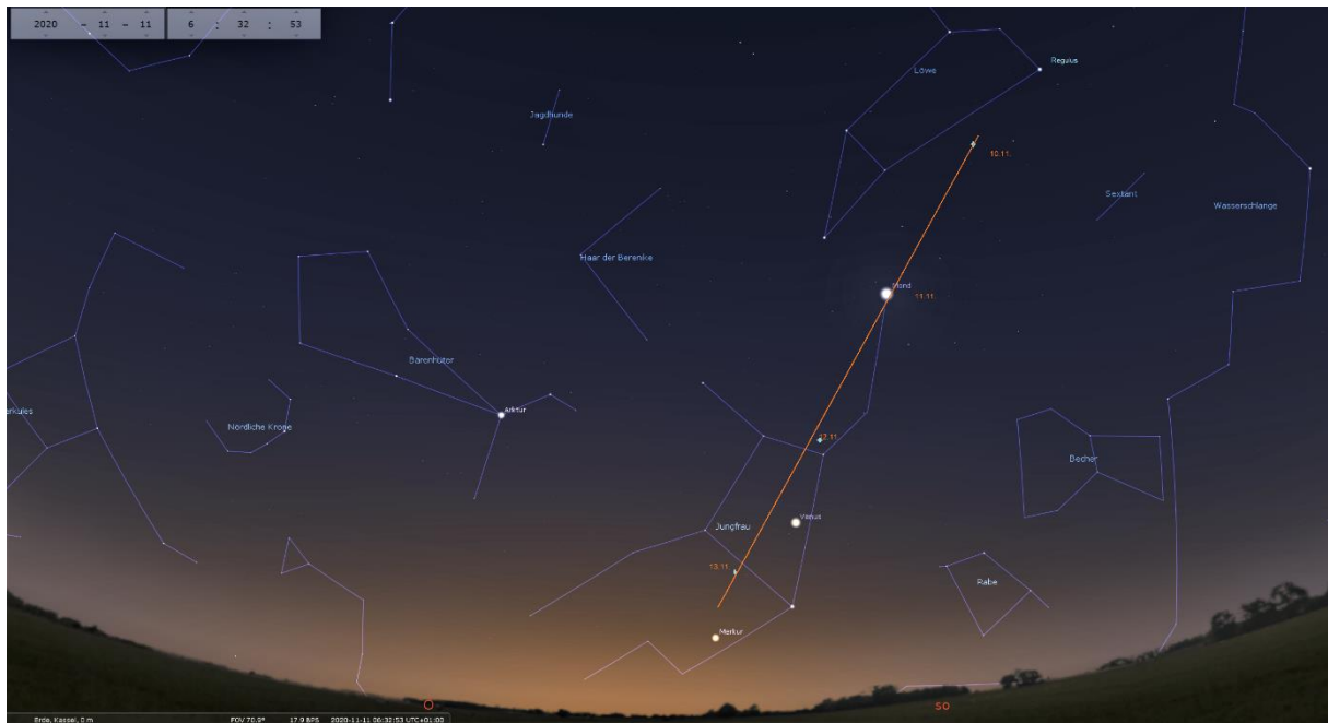
Sternkarte von Stellarium, bearbeitet von KP Haupt